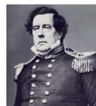
Amiral Perry "öppnade" Japan för handel med omvärlden.

Theodore Roosevelt, som var USA:s president när detta korta krig rasade, hade inget att invända mot Japans nya särställning i Manchuriet. 3 Det övriga Kina var redan uppdelat i olika intressesfärer, det vill säga områden där olika västerländska kolonialmakter kunde tjäna på kinesernas utsatthet. Att Japan på detta sätt sällat