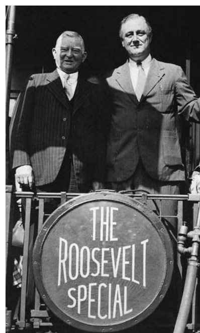
F D Roosevelt till höger i valrörelsen 1932 (med sin blivande vice-president, den obemärkte John Garner).

Förslag som dessa klingade ohörda, och hade dessutom det gemensamt att Japan visade sig mycket mer angeläget om att stå på god fot med USA än med axelmakterna i Europa. Således avhöll sig Japan från att anfälla sin gamle fiende Sovjetunionen när Tyskland gjorde det, eftersom detta bedömdes leda till omedelbart krig även mot USA. 22