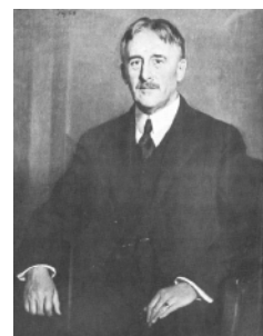
Henry Stimson, en av de politiker som ledde in USA på krigets väg.

Presidentvalet i USA 1932 ledde emellertid till att en mycket anti-japansk man kom till makten nämligen "New Deal" Franklin Delano Roosevelt. Det innebar att han var på samma linje som sin utrikesminister Henry Stimson. Denne hade redan när han satt med i föregående president Hoovers regering – förgäves – engagerat sig för att USA inte skulle erkänna den japanska marionettregeringen i Manchuriet. Stimson hänvisade till Kellogg-Briandpakten från 1928, som ungefär gick ut på att våld inte fick användas i politiskt syfte, men hade ändå låtit den sovjetiska aggressionen mot Kina 1929 passera obemärkt. Dessutom hade han själv tidigare förlöjligat President Wilsons fåfängliga strävan efter att bevara stabilitet i Latinamerika genom att inte erkänna regimer där som kommit till makten genom våld. Stimsons principfasta (men selektiva) förhållningssätt till Kellogg-Briandpakten gick för övrigt emot den samtida attityden hos länder som Storbritannien och Frankrike, samt mot de återhållsamma principer som George Washington formulerat för utrikespolitiken.