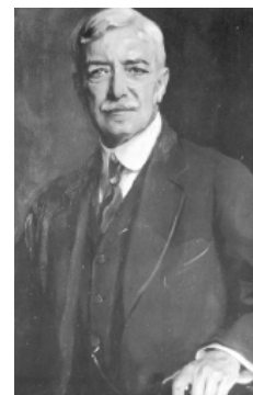
Robert Lansing, ministern som fruktade för att kommunismen skulle spridas.

”Min föreställning är att de [japanerna] kommer att skicka förstärkningar till Sibirien och försöka stärka Seminoffs [vita] styrka. Jag kan inte se hur den japanska regeringen skulle kunna utöva någon annan politik i ljuset av den mycket påtagliga faran för Japan om bolsjevikerna skulle få fotfäste i Manchuriet och samarbeta med de koreanska revolutionärerna. Under dessa omständigheter borde vi helt säkert inte höja någon protest mot att Japan sänder en tillräcklig styrka för att hejda bolsjevikernas framryckning, för spridandet av bolsjevismen i Fjärran Östern vore ett skräckinjagande hot mot civilisationen.” 9